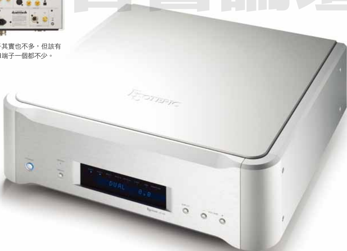
↓ D-02的外觀與P-02相同，這是一套西裝的設計。面板上連電源只有五個按鈕，簡潔大方。