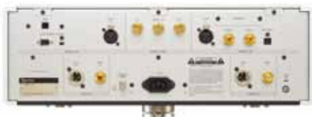
↑ D-02背板上的端子其實也不多，但該有的都有了，當然Word端子一個都不少。

到底P-02/D-02的聲音表現如何？在此我必須坦白的說，它跟我在論壇279期寫的「Esoteric K-01 幾乎無懈可擊」的聲音特質基本上是一致的，差別僅在於所有的細微處都更好一些。例如音質更好一些、寬鬆程度更鬆一些，解析力更高一些、細節更多一些等等。這些「更」就是電源供應多一倍、數位類比轉換晶片多一倍、改用分砌式純A類類比緩衝級所換來的。以二倍售價換取這些細